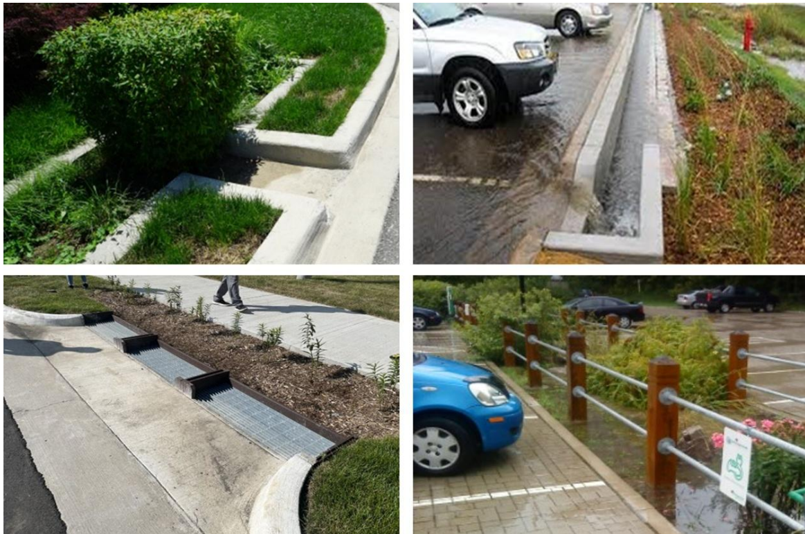
Rysunek 3 Rekomendowane sposoby odwodnienia ulic do rozwiązań NBS