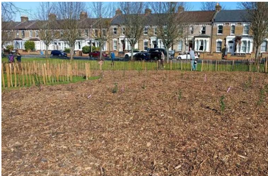
Rysunek 1 Założony w marcu 2025 „mikrolas” w Paignton Park